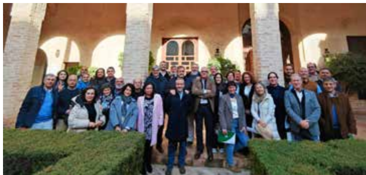
Asamblea General Ordinaria del Consejo Andaluz de Colegios Oficiales de Veterinarios en el Palacio de los Marqueses de la Algaba (Sevilla).